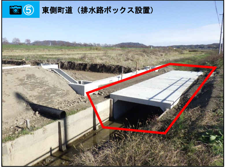
⑤ 東側町道（排水路ボックス設置）