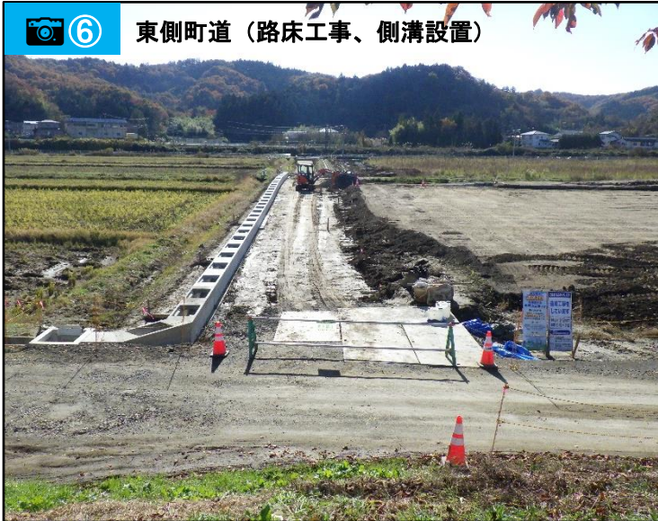
⑥ 東側町道（路床工事、側溝設置）