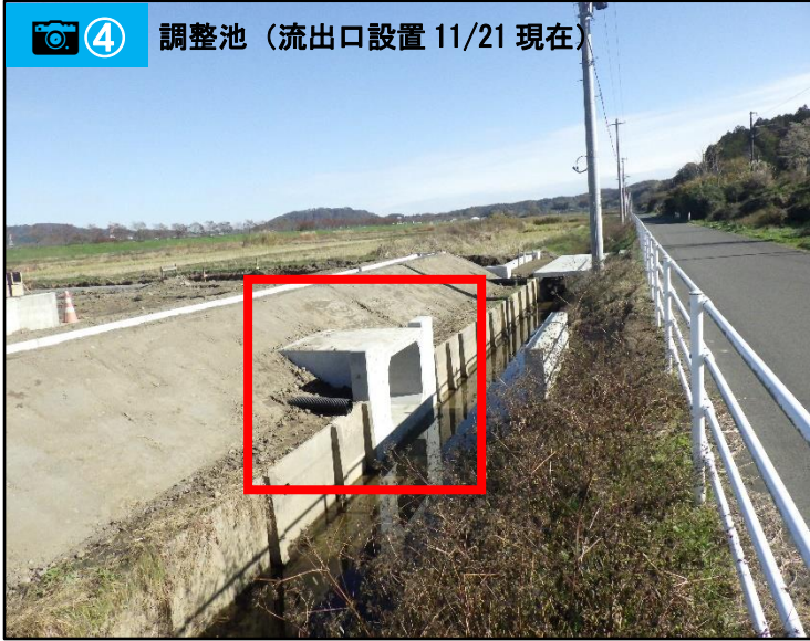
④ 調整池（流出口設置 11/21 現在）